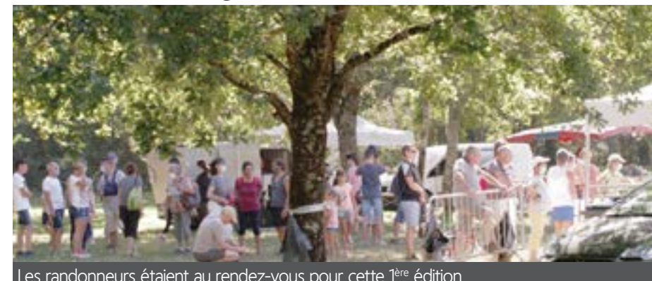
Les randonneurs étaient au rendez-vous pour cette 1 ère édition

Le 18 juillet dernier s'est tenue la 1 ère Randonnée Gourmande en Forêt de Chambiers, qui a dépassée les espérances de l'association Courir à Durtal, qui l'organisait. Pour cette 1 ère édition, 250 personnes ont répondu présents !