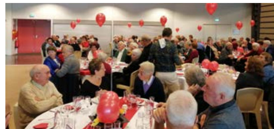
Le CCAS vous donne à nouveau rendez-vous en 2021

Tous les ans, les Durtalois de plus de 70 ans bénéficient du repas des aînés organisé au mois d'octobre par le CCAS de la commune.