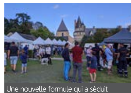
Une nouvelle formule qui a séduit

Cette année le Forum des associations a changé de formule et de lieu. L'idée étant de créer un village des associations, le Forum s'est installé sur la place des Terrasses le temps d'un après-midi ensoleillé.