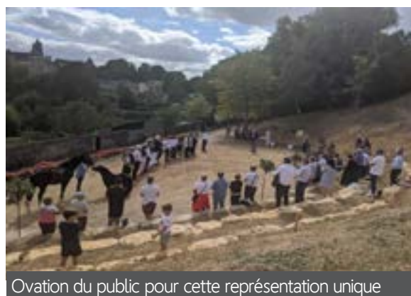
Ovation du public pour cette représentation unique