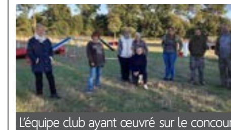
L'équipe club ayant œuvré sur le concours

Le club canin durtalois Les Pattes Agiles a organisé son concours annuel d'agility le 24 septembre dernier, à huit clos en raison des règles sanitaires.