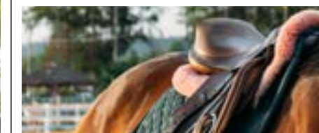
Les rendez-vous de l'Hippodrome de La Carrière Les Rairies

Samedi 31/10 13h00 GALOP Dimanche 01/11 13h00 GALOP Dimanche 15/11 13h00 GALOP