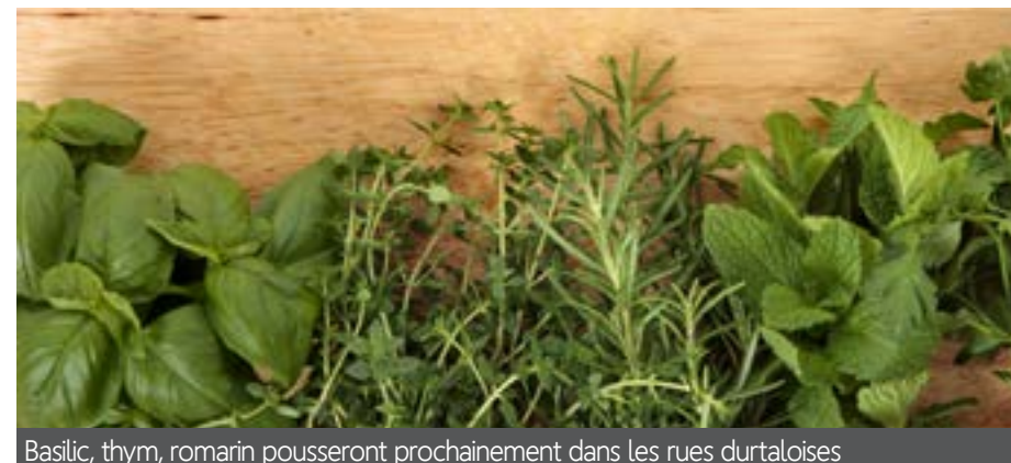
Basilic, thym, romarin pousseront prochainement dans les rues durtaloises