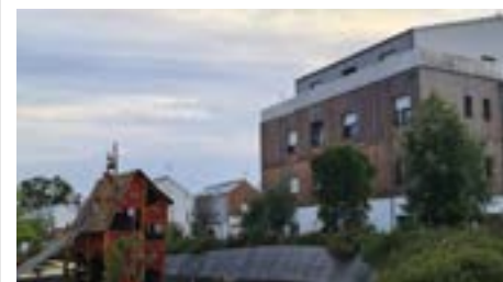
Un habitat participatif et écologique du Chêne Vert

Le 16 septembre dernier, les élus municipaux ont visité le lotissement en construction du Chêne Vert à Verrières en Anjou. L'entreprise publique Alter Anjou Loire Territoire spécialisée dans l'aménagement, le développement économique et l'environnement a expliqué le concept de ce lieu : « Organisé en quartier, le projet vise à prendre en compte la dimension intergénérationnelle de la ville autour notamment de la vie de quartier. Sur une superficie de 50 hectares environ, l'éco-quartier du Chêne Vert devrait accueillir à terme entre 1 000 et 1 300 logements, ainsi que des équipements publics d'accompagnement et des services / commerces de proximité en rez-de-chaussée de certains immeubles. »