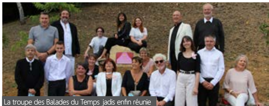
La troupe des Balades du Temps jadis enfin réunie

Ce fut une belle journée ensoleillée comme elle les aimait tant.