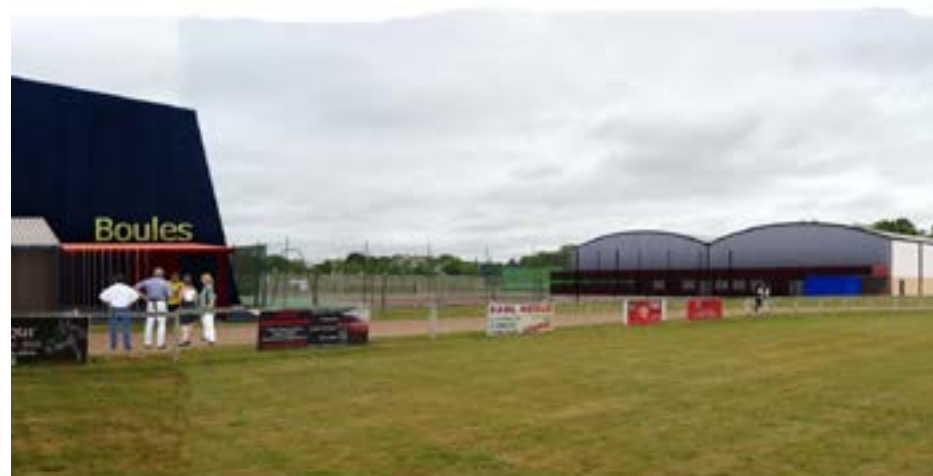
Le boulodrome et les halles de tennis tels qu'ils seront visibles du terrain de football

Dans le cadre du projet du plateau sportif, une première tranche de travaux se prépare. Les travaux devraient démarrer probablement au cours du premier semestre 2021.