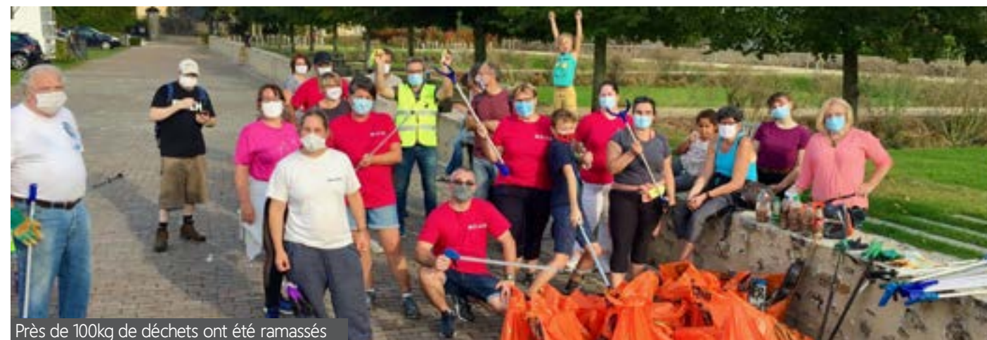
Près de 100kg de déchets ont été ramassés