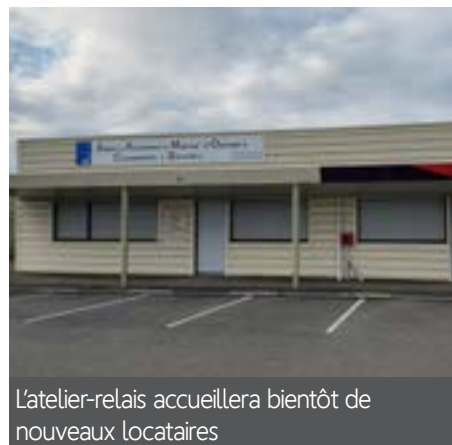
L'atelier-relais accueillera bientôt de nouveaux locataires

Lors du Conseil municipal du 8 septembre, la Municipalité a approuvé l'acquisition d'un atelier-relais situé rue des Frères Lumière, composé d'un ensemble de bureaux, wc, accueil, réserve, circulation, salle de réunion, d'environ 149 m 2 pour un montant de 160 000 €.